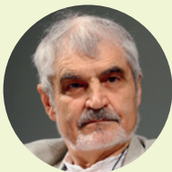
Serge Latouche politologue, économiste et philosophe, précurseur du mouvement de la décroissance