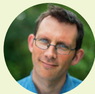
Rob Hopkins fondateur du mouvement Villes en transition