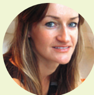
Béa Johnson auteure de «Zéro Déchet»